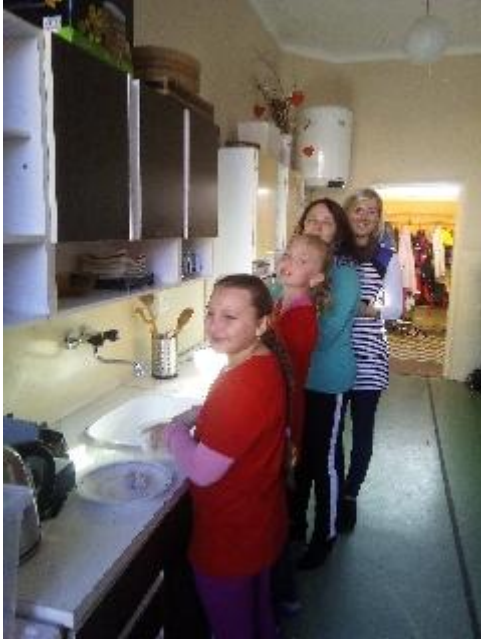
Výlet do Kremnice 10.11.2017