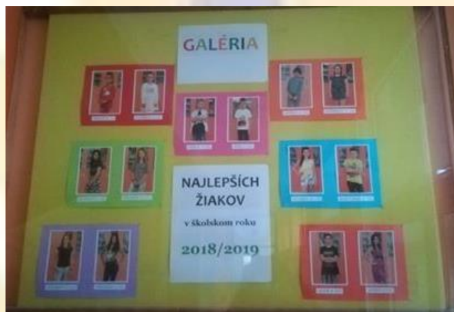
Galéria najlepších žiakov v šk. roku 2018/19