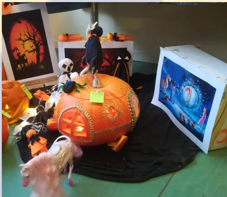
2. miesto – Kristína Prčová