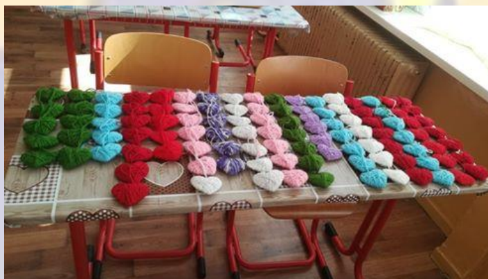
Kružok Ručné práce – výroba srdiečok